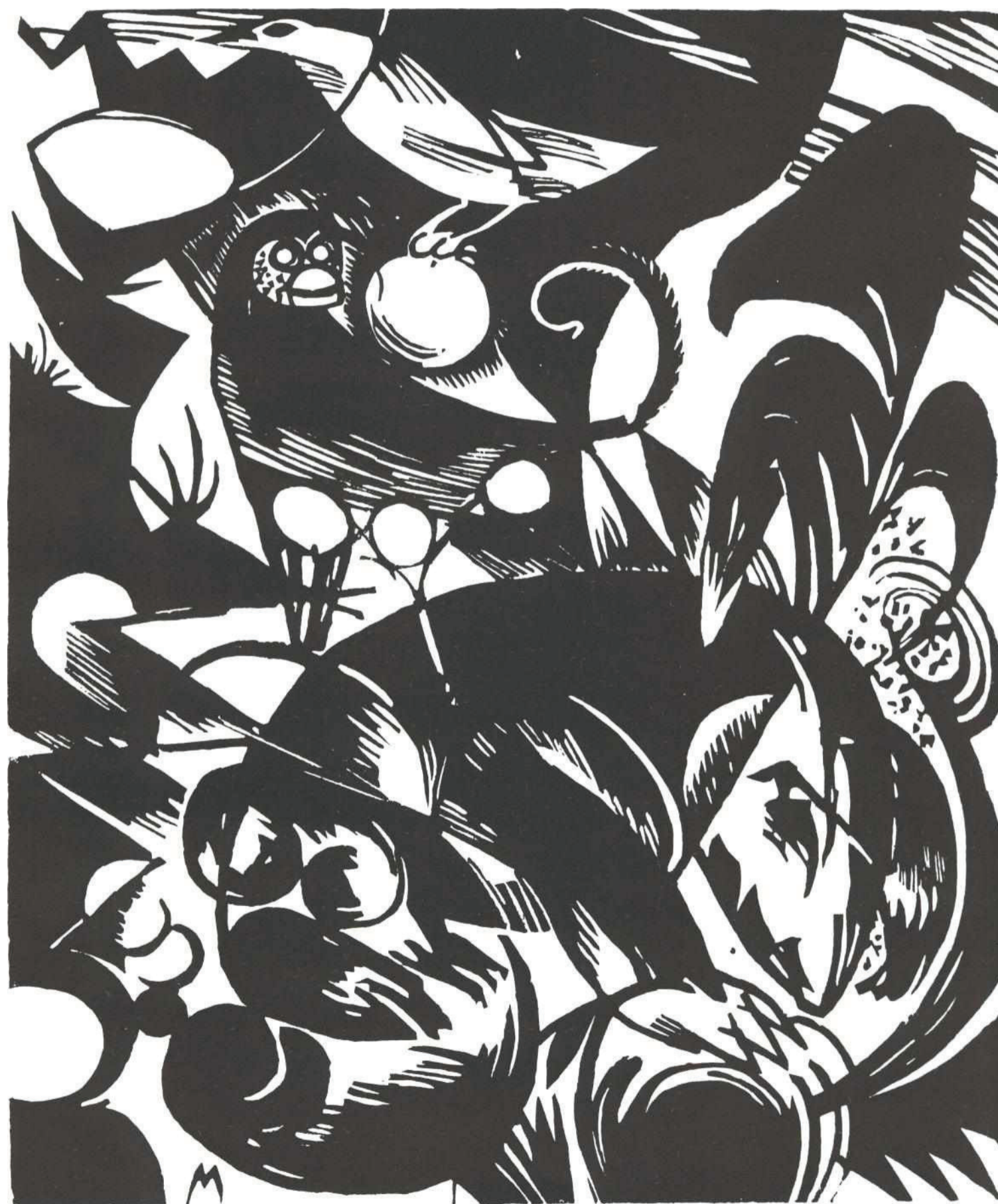
Franz Marc : Mitul creației : Creation myth : Schöpfungsgeschichte