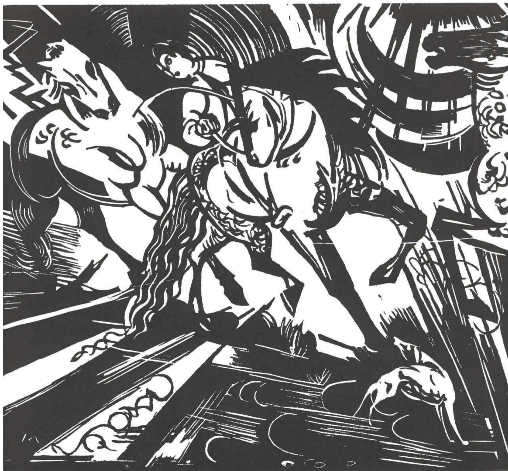
Franz Marc : Școala de echitație după Ridinger : Riding shool acording to Ridinger : Reitschule nach Ridinger