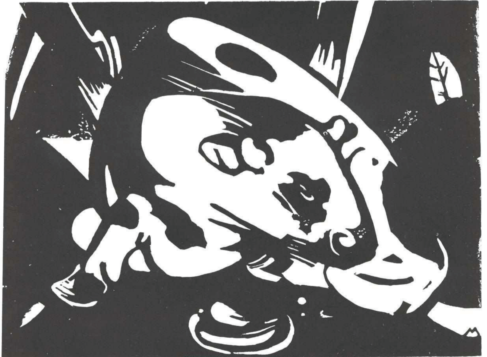
Franz Marc : Taurul : The Bull : Der Stier