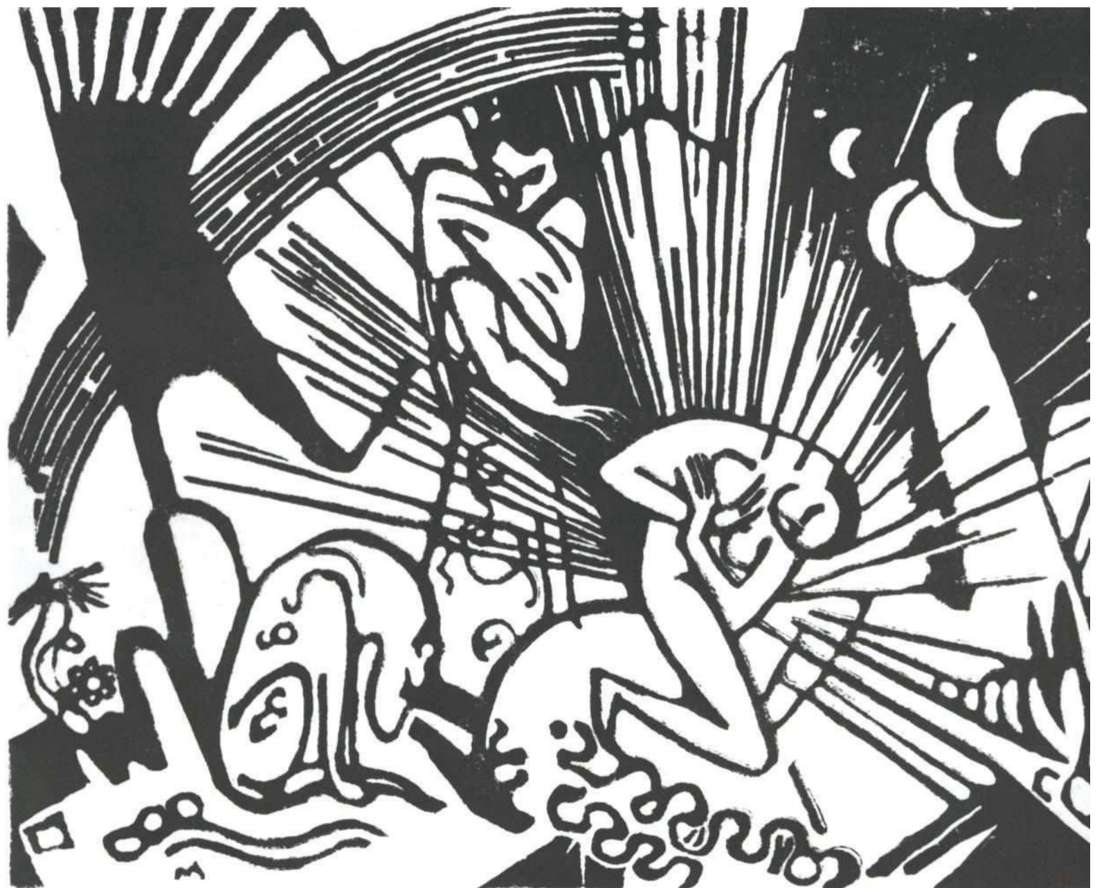
Franz Marc : Reconciliere : Reconciliation : Versöhnung