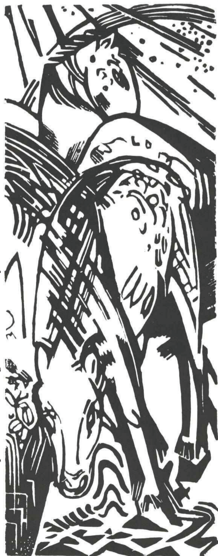
Franz Marc : Cal adápându-se : Drinking horse : Trinkendes Pferd

todavía pertenece únicamente al fondo más escondido de mi memoria. Ha sido su secreto y lo sigue siendo de momento: la figurilla con la que había salido a la meseta entonces, antes de mi partida precipitada de Bactriana, figuraba una mujer y, según todas las probabilidades, el planeta iba a producirla .